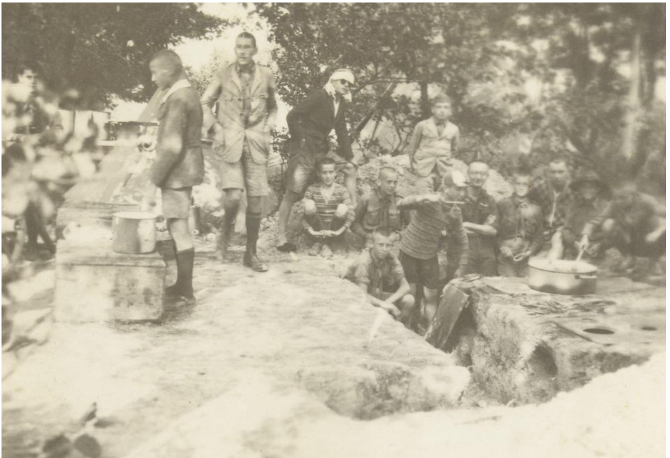
(feltehetően ugyanakkor s ugyanott készült két további kép)