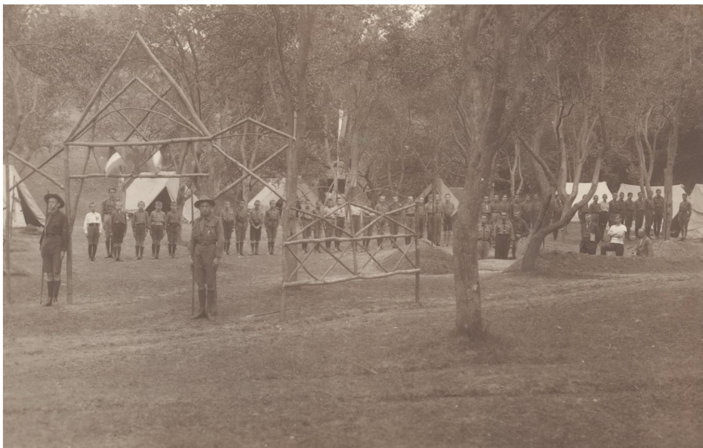
(balszélen a sorfal mögött áll ifj. Varga Gyula)